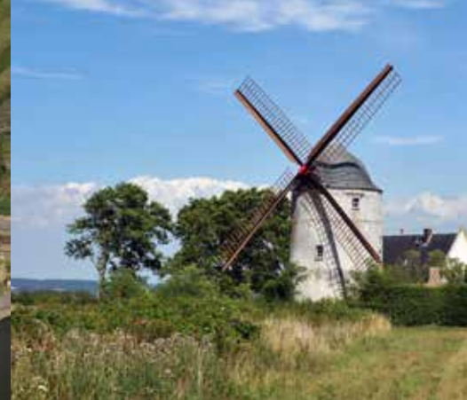
Le moulin de Moringhem inscrit au titre des Monuments historiques en 2015.