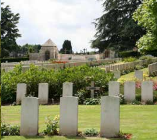
Le cimetière militaire des Bruyères de Saint-Omer, souvenir de la forte présence britannique durant la Première Guerre mondiale.