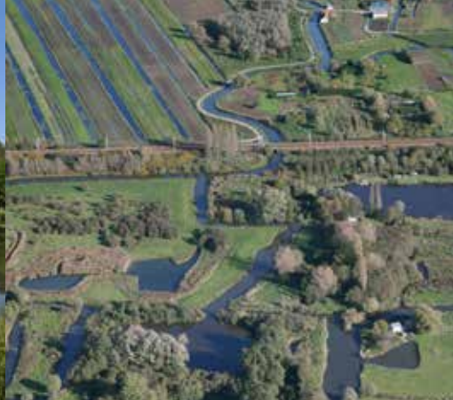
Les deux visages du marais : au premier plan le marais haut, à l'arrière plan le marais bas.