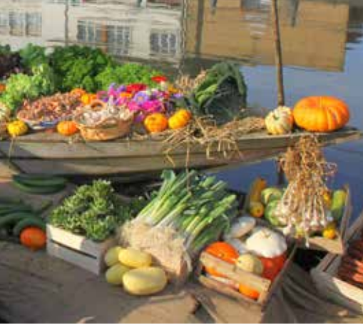
Vente de légumes traditionnels du marais sur le canal du Haut-Pont à Saint-Omer.

Par la qualité de ses savoir-faire et par ses coutumes, le territoire s'inscrit dans les grandes traditions du Nord.