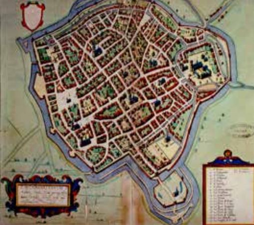
Perspective cavalière, la trame de la voirie médiévale a été préservée à Saint-Omer. Plan Ortelius 1594. Bibliothèque d'agglomération de Saint-Omer.