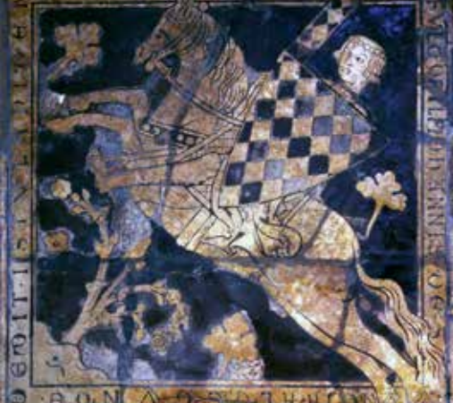
Foulque de Saint-Aldegonde, membre d'une grande famille audomaroise, immortalisé sur un carreau de pavement de la cathédrale de Saint-Omer au XIII e siècle.