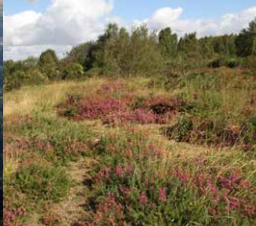
La bruyère sur le plateau des Landes à Helfaut.