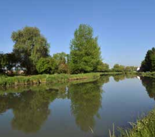
L'ancien bras du canal de Neuffossé est un élément structurant du pôle urbain.

Au fil des siècles les hommes ont façonné un paysage dont la lecture retrace l'histoire du territoire.