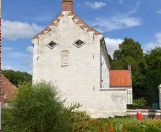
A Tournehem-sur-la-Hem, pignon de maison en pierre et brique.