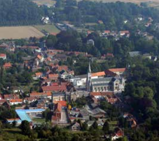
L'église, les vestiges de l'abbaye Sainte-Colombe et les châteaux de Blendecques sur les berges de l'Aa.