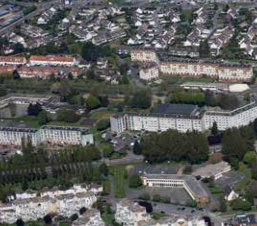
La ZAC Sainte Catherine mêlant habitat collectif et individuel se développe entre Arques et Saint-Omer dans les années 1970.

Territoire d'interface entre le Haut-Pays d'Artois et la plaine flamande, le pays de Saint-Omer offre une mosaïque de paysages.