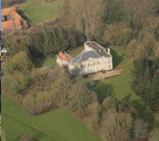
Château de la famille Titelouze de Gournay, fin du XVIIIe siècle, Clarques.