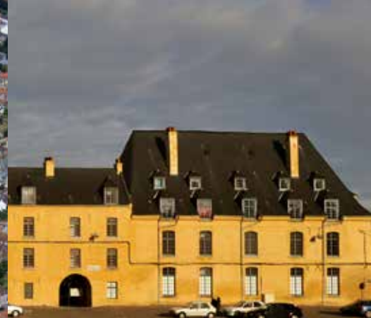
La caserne de la Barre, édifiée au cours du XVIIIe siècle, est un des témoins du passé militaire de la ville de Saint-Omer.