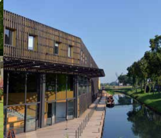
La Maison du Marais à Saint-Martin-au-Laërt est un équipement dédié à la valorisation du marais.