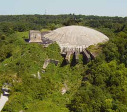
La Coupole d'Helfaut est un immense bunker, base de lancement de fusées V2 sur Londres construit par l'organisation Todt en 1943-44.