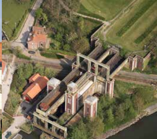
L'ascenseur à bateaux des Fontinettes à Arques classé au titre des Monuments historiques en 2013.