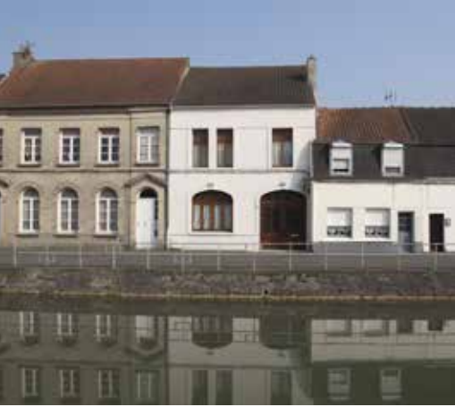
Dans le faubourg du Haut-Pont à Saint-Omer, les maisons exigües des ouvriers agricoles côtoient les maisons plus opulentes des maraîchers.