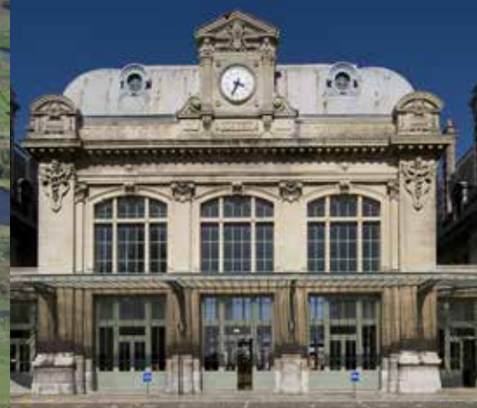
Le pavillon des voyageurs de la gare de Saint-Omer édifié en 1902-1903. Inscrit au titre des Monuments historiques en 1984.