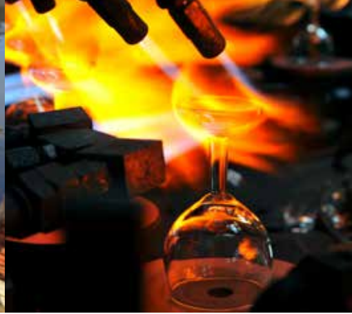
Illustration du savoir-faire industriel de la verrerie Arc International.