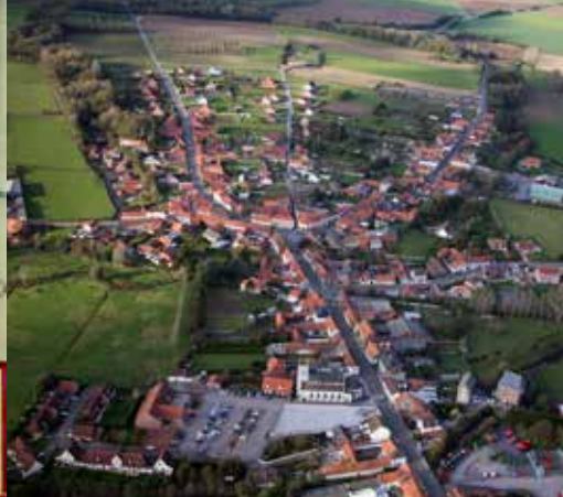
Thérouanne. Au premier plan la Grand'Rue. Dans son prolongement à l'arrière plan, la rue Saint-Jean conduit au site de l'ancienne cathédrale.