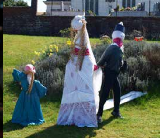
Tous les ans au mois d'avril, le village de Moringhem se peuple d'épeutnaerts, terme local pour désigner les épouvantails.