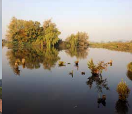
L'étang du Romelaëre à Clairmarais.