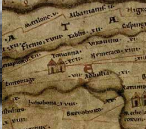
Détail de la Table de Peutinger. Cette copie médiévale d'une carte antique illustre bien la position stratégique de Théroouanne, au carrefour de plusieurs voies commerciales. ÖNB Bildarchiv, Wien, Cod. 324.