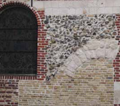
Le mur nord de l'église de Serques montre la variété des matériaux employés : brique rouge, brique jaune, silex et craie.

Le bâti du pays reflète la rencontre entre un sous-sol aux propriétés variées et une histoire mouvementée.