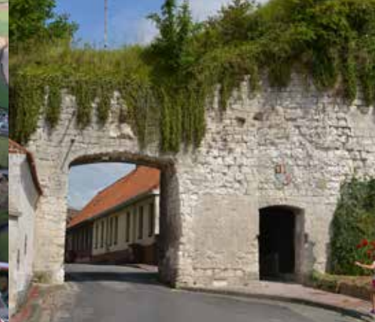
Vestige d'une porte médiévale du bourg castral de Tournehem-sur-la-Hem.