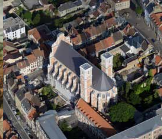
Consacrée en 1636, la chapelle des Jésuites illustre la puissance de cet ordre religieux.