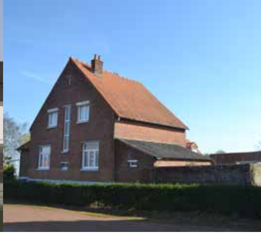
Suite aux bombardements alliés, le hameau de Coubronne à Ecques est presque intégralement reconstruit après la Seconde Guerre mondiale.