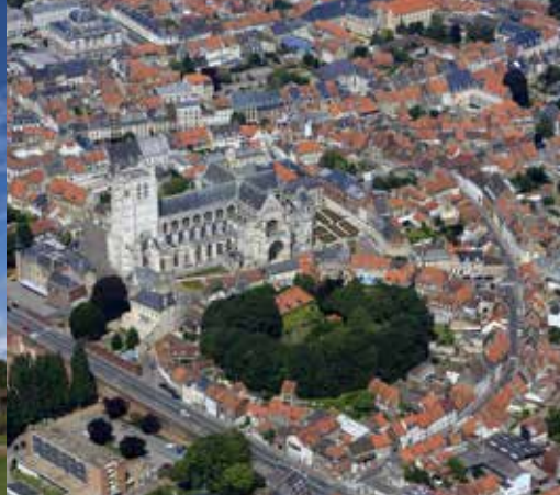
La motte castrale de Saint-Omer, dans le tissu urbain. Au sommet de celle-ci, une prison, construite au XVIIIe siècle, est aujourd'hui un lieu d'exposition et une résidence d'artistes. A proximité, la cathédrale gothique du XIIe - XVIe siècles et les fortifications modernes en brique.