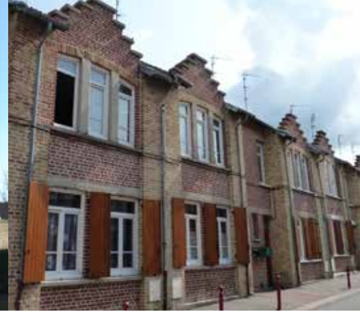
Arques : exemple d'habitat standardisé de la fin du XIXe siècle.