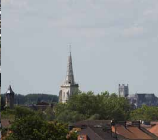
Ligne d'horizon d'Arques et Saint-Omer avec leurs édifices emblématiques : le château et l'église d'Arques et la cathédrale de Saint-Omer.