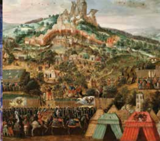
Vision fantastique du siège de Théroutanne par les troupes de Charles Quint en 1537. Au premier plan, le camp de l'armée impériale et à l'arrière plan, la cité assiégée. Tableau d'Herri Met de Bles, XVI e siècle.