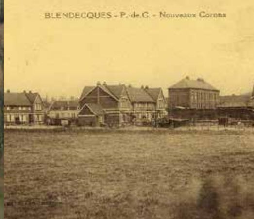
Cité ouvrière à côté de la papeterie Avot à Blendecques vers 1900.