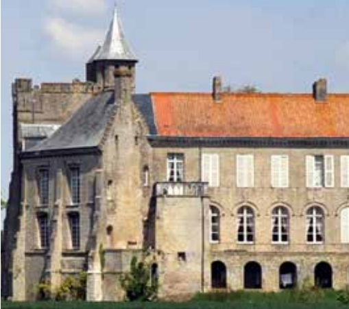
Le château d'Ecou à Tilques inscrit au titre des Monuments historiques en 2014.