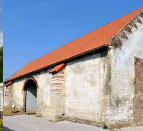
Dépendance agricole en craie et brique dans le hameau de Nielles-lès-Thérouanne.