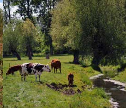
La vallée de la Lys à Rebecques.