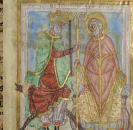
Dagobert remettant la crosse à Omer, moine de l'abbaye de Luxeuil, qu'il vient de désigner évêque de Théroouanne. Enluminure extraite de la Vie de Saint-Omer, XIe siècle, ms. 698, Bibliothèque d'agglomération.