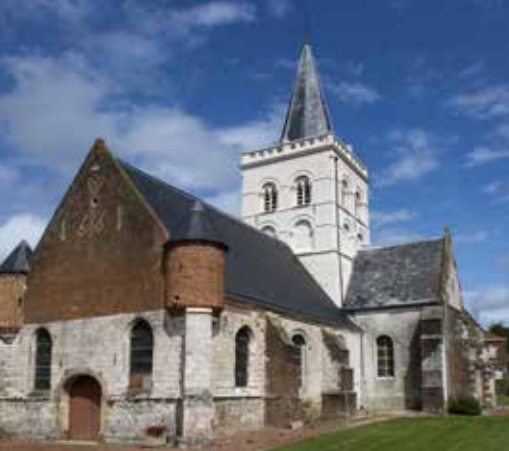
L'église Saint-Nicolas d'Ecques et sa tour romane ont été fortifiées au XVIIIe siècle.

La richesse et la variété des patrimoines témoignent du rayonnement de la splendeur passée.