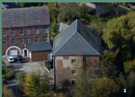
1. L'ancien moulin à farine et son magasin à blé, installés sur les berges de la Lys. Détail d'une photographie aérienne